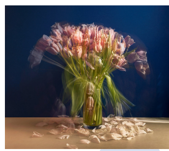
웨슬리(Wesely, Michael/독일/1963-) 정물화(사진/가면 크기/2020년)