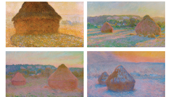
<건조 더미> 연작(캔버스에 유채 물감/봄) 60×100cm/1891년, (여름) 65×100.5cm/1890~1891년, (가을) 65.8×101cm/1890~1891년, (겨울) 65.3×100.4cm/1890~1891년)

모네는 같은 장소에서 계절, 시간, 날씨를 달리해 여러 작품을 그렸으며 빛의 변화에 따른 특징을 작품에 잘 담았다. 봄, 여름, 가을, 겨울 각 계절에 관찰한 건조 더미의 모습을 표현하였다.