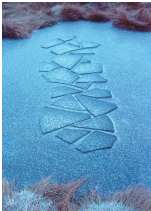
골즈워디(Goldsworthy, Andy/영국/1956~) 얼음 위의 얼음(얼음/가변 크기/1980년)

<얼음 별>은 고드름이 얼어붙는 현상을 활용해 만들어진 대지 미술 작품이다. 골즈워디는 자연 환경에서 발견된 재료들을 사용해 자연의 질서와 구조를 시각적으로 표현하였다. 그는 추운 겨울 고드름에 물을 묻히고 서로 붙여서 별 모양의 형태를 만들었다. 골즈워디의 작품은 한순간 존재하고 사라지기 때문에 작품이 존재하였다는 사실은 사진으로 알 수 있다.